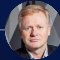
Rudolf Vadovič Octigon, a.s.