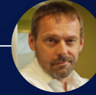
Roman Kocourek NAY a.s.